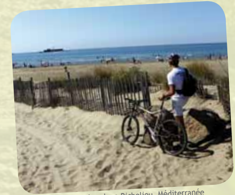
Le Cap d'Agde, plage Richelieu, Méditerranée