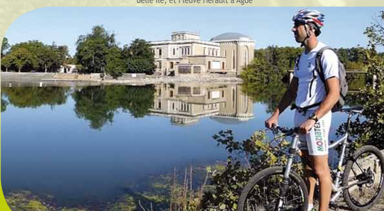
Belle Ile, et Fleuve Hérault à Agde

En voiture : A 75 sortie N°49 Le Caylar L'idéal est de laisser une voiture au point de départ et une à l'arrivée. Agde • Le Caylar : (76 km - 1h) A 75 sortie N°60 Agde